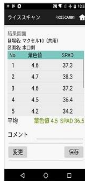
測定終了時表示画面