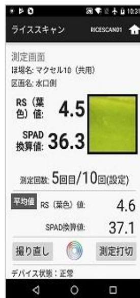
測定結果表示画面